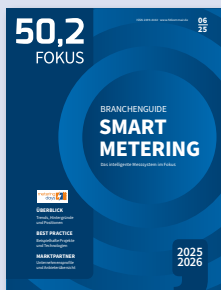
Das intelligente Messsystem im Fokus