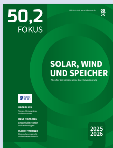
Alles für die klimaneutrale Energieversorgung