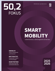
Ladeinfrastruktur, Last- und Lademanagement und Services