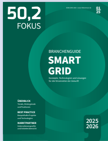
Konzepte, Technologien und Lösungen für die Stromnetze der Zukunft