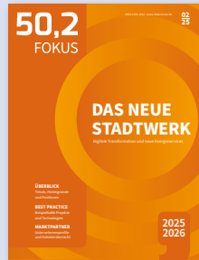
Digitale Transformation und neue Energieservices