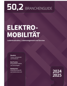
Ladeinfrastruktur, Lademanagement und Services