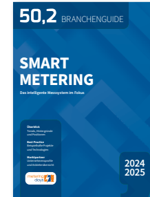
Das intelligente Messsystem im Fokus