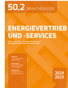
Strom und mehr – so lassen sich die neuen Energiekund:innen gewinnen und binden