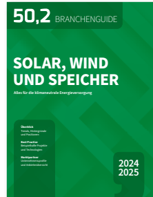
Alles für die klimaneutrale Energieversorgung