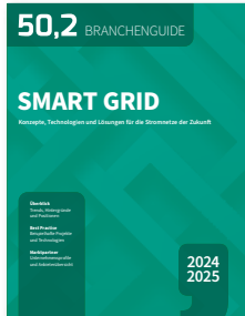
Konzepte, Technologien und Lösungen für die Stromnetze der Zukunft